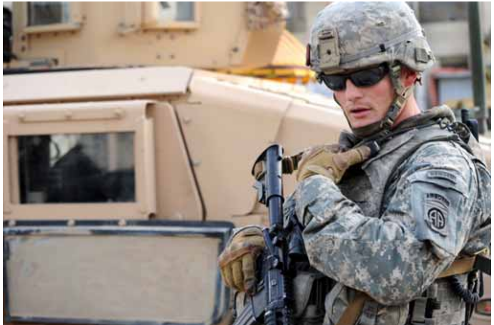
En amerikansk soldat i Bagdad fortæller 29. marts over radioen, at irakiske sikkerhedsfolk er i kamp mod oprørere. 27. maj blev en amerikansk soldat og fire irakiske borgere dræbt af en bombe i Bagdad. Det skriver dagbladet The New York Times.