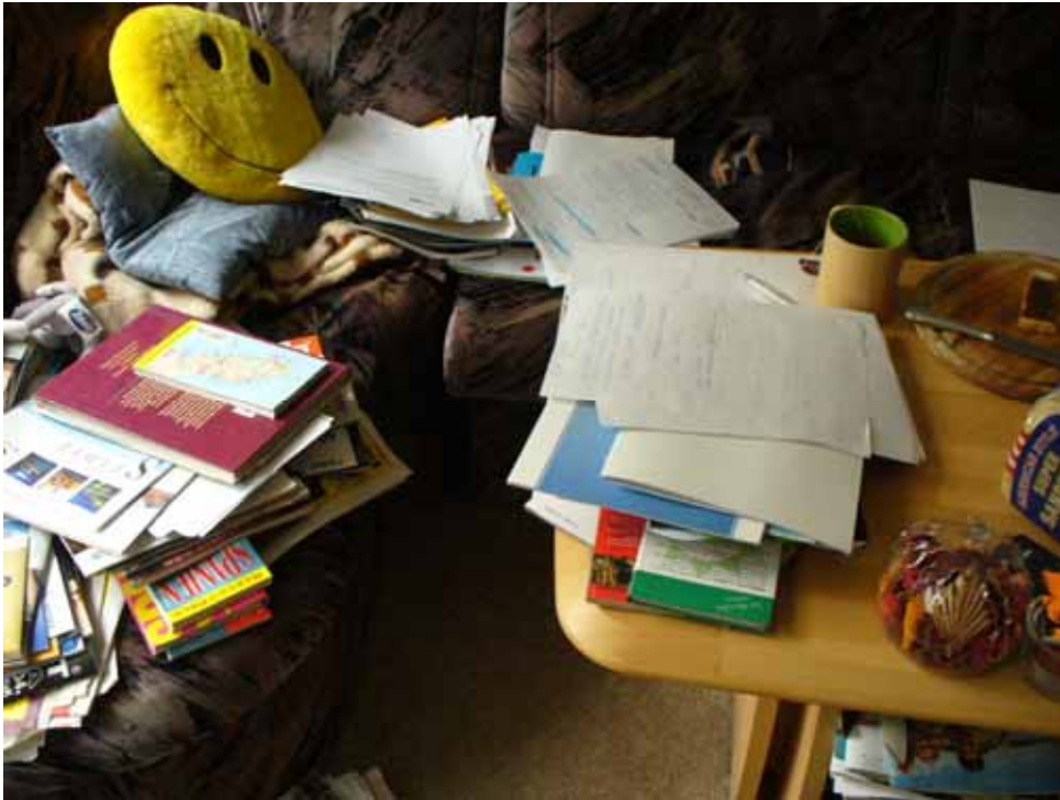
Sådan ser de fleste elevers værelser vist ud, før de skal op til den mundtlige prøve.

Når et teater besøger en skole, plejer eleverne at se en forestilling. Men der er også andre muligheder. Brønshøj Skole i København bruger teaterfolk til at forberede 8. og 9. klasserne til den mundtlige prøve, skriver Månedsmagasinet Undervisere. Flere elever er meget nervøse for at være i centrum og samtidig svare på spørgsmål. Nogle lider direkte af angst for at gå til mundtlig eksamen.