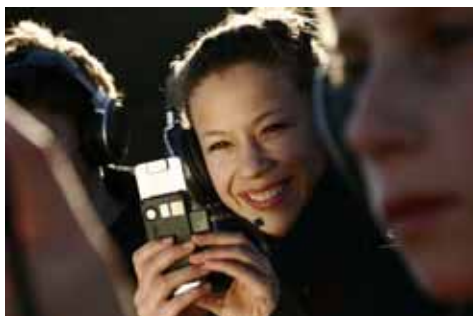
Elever fra Elsted skole i fuld gang med natur- og dramaprojektet "De Udvalgte"

Hvad har undervisning i faget naturvidenskab og teater med hinanden at gøre? En hel masse, hvis man spørger elever fra 6. - 8. klasse på Elsted Skole ved Århus. De er "prøvekaniner" i en helt ny form for læring. Hvor pensum, udendørs motion, ny teknik og drama sættes sammen. I mandags den 25. maj var der premiere på projekt AudioMove, der både er interaktivt og mobilt.