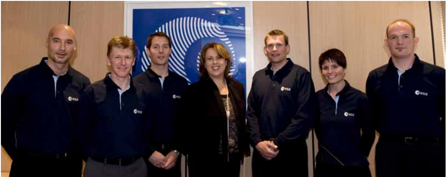
Sådan ser det nye hold af europæiske astronauter ud. Nummer tre fra højre er danske Andreas Mogensen.

Så lykkedes det! Danmark har fået sin allerførste astronaut. Andreas Mogensen er 32 år og rumforsker. Hvornår vi kommer til at se ham gå på månen eller blot på vej til en rumstation, er der vist ingen, der ved. Det kan tage rigtig lang tid - mindst fire år - før der bliver en ledig plads. Den nybagte astronaut tror selv på mellem 5 og ti år, siger han til nyhedsmedierne.