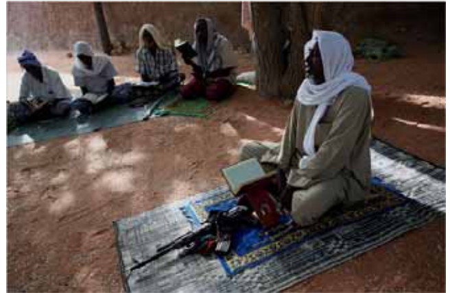
Sufi'er holder koranskole.

Det er stadig kun en fjerdedel af alle børn i Somalia, der kommer i skole. Men den høje dødelighed blandt