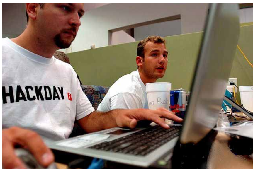
Unge hackere er samlet til Yahoo's Hack Day i Californien. De skal prøve at knække koderne, før andre gør det.

Mange af de unge mener, at de har en stor teknisk viden om at hacke. De kan selv finde it-værktøjer på nettet til hacking og kan også godt bruge dem.