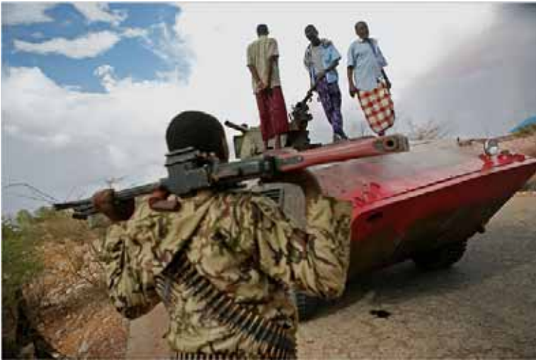
Somaliske Sufi'er ved en vagtpost.

Somalia har længe været kendt for piraterne, der kaprer store skibe. (Læs UgeXpressen nr. 214). Nu skriver nyhedsmedierne igen om det fattige land på Afrikas østkyst. I næsten tyve år har Somalia været plaget af kampe mellem forskellige stammeklaner. En svag regering har ikke kunnet løse problemerne. Så en ny konflikt er blusset op, skriver det amerikanske dagblad The New York Times.